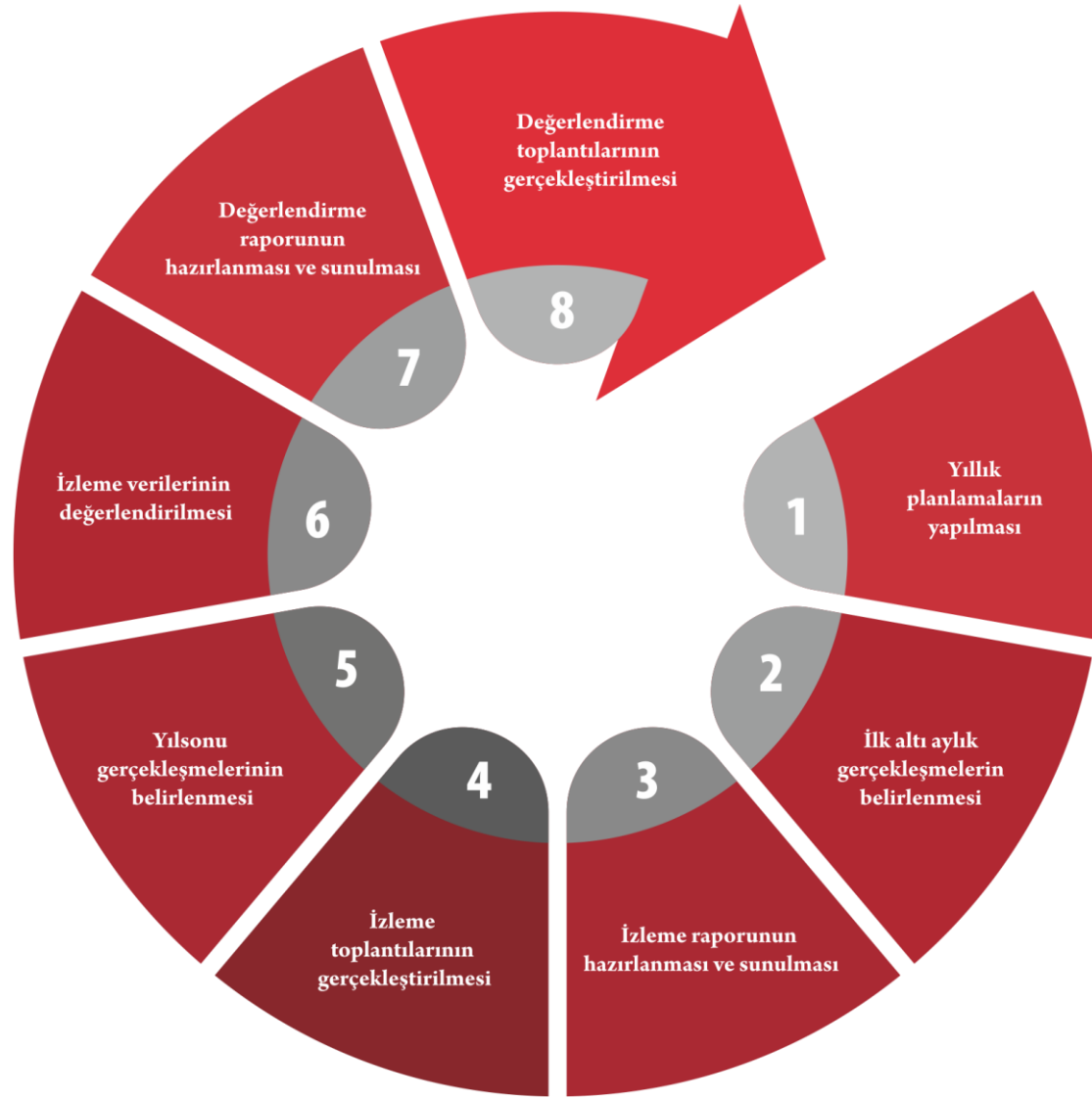
Şekil 2. İzleme Değerlendirme Süreci